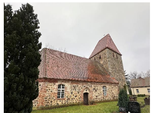
Dorfkirche Löhme

Die Dorfkirche Löhme im Landkreis Barnim ist eine spätgotische Feldsteinkirche aus dem späten 15. oder frühen 16. Jahrhundert, die im Lauf der Zeit viele Veränderungen erfahren hat. Der Kirchhof mit Mauer aus dem 18. Jahrhundert und Kriegerdenkmal von 1920 liegt am Jakobsweg, der durch den Ort hindurchführt. Seit dem 12. Jahrhundert durchzieht der Jakobsweg ganz Europa. Die nördliche Route des Jakobsweges durch Brandenburg, von der Oder bis nach Berlin, beginnt in Frankfurt/Oder. Sie führt im Landkreis Barnim durch Werneuchen, Seefeld, Löhme und Börnicke bis nach Bernau bei Berlin. Der Haussee bietet eine weitere Möglichkeit, sich die Barnimer Landschaft bei einem Rundweg mit Naturlehrpfad genauer anzuschauen.