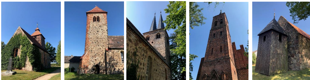
Die Kirchen im Niederen Fläming: Niederseefeld, Hohenseefeld, Ihlow, Meinsdorf und Kossin