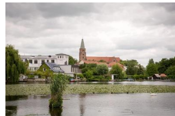
Dom Sankt Peter und Paul zu Brandenburg an der Havel

30.09.2024: epd-Wochenspiegel Ost Nr. 40/2024: Millionenförderung vom Bund für Dom zu Brandenburg. Der evangelische Dom zu Brandenburg erhält sieben Millionen Euro Bundesmittel für ein großes Sanierungsprojekt. Der Haushaltsausschuss des Bundestags hat die Gelder für den mittelalterlichen Ostflügel der Domklausur bewilligt. Die Förderung diene dem Erhalt und der Modernisierung der historischen Bausubstanz sowie der zeitgemäßen Präsentation und Aufbewahrung der Kunst- und Kulturschätze des Domstifts. Der Dom zu Brandenburg wurde vor mehr als 850 Jahren gegründet.