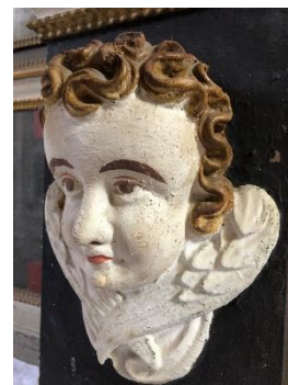
Detail am Altar in Kossin