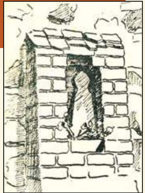
Tönernes Männchen im Chorpfeiler der Schmiedeberger Kirche (Uckermark); Zeichnung von Horst Schubert in: Jahrbuch des Kreises Angermünde 1956, S. 11

Dr. Reinhard Schmook ist Leiter des Oderlandmuseums Bad Freienwalde und Vorstandsmitglied im Verein für Berlin-Brandenburgische Kirchengeschichte.