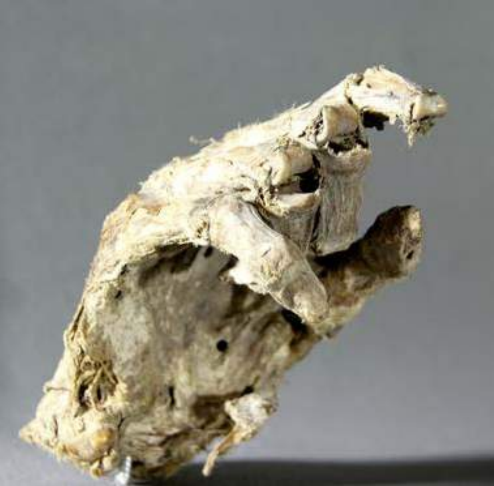
Mumifizierte menschliche Hand in der Dorfkirche Lunow (Barnim)

sich Freunde der Schmiedeberger Kirche eines Tages erbarmen und einen neuen Kobold in die jetzt leere Nische stellen.