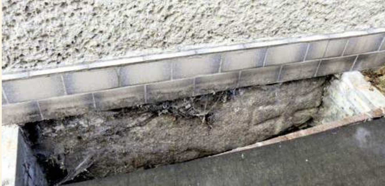
Der „Betstein“ im nördlichen Giebelfundament des Hauses Niethe gegenüber der Lunower Kirche

Seit diesem Schicksalsschlag schien es, als ob der Satan von Martin Bertram Besitz ergriffen hätte. Der bisher so brave und fleißige Sohn saß nun öfter im Dorfkrug und vernachlässigte die Wirtschaft. Alle Bitten und Ermahnungen des Vaters und der Schwester stießen auf taube Ohren und Martin trieb es nur noch ärger.