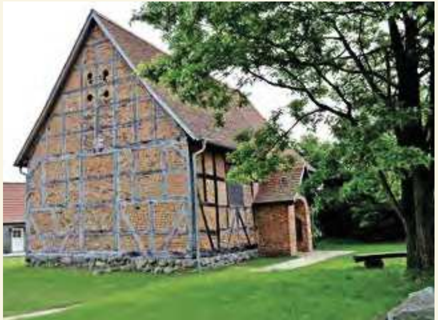
Die Gutskapelle in Horst

die herbe Atropos rechts mit scharfer Schere den Lebensfaden ab. Oben schmückt ein Blütenkranz aus Rosen den Giebel. Von Schadows Werkstatt wurde das Grabmal nicht nur hergestellt, die Gesellen besorgten auch die Materialien für den Einbau und die Ölfarben für den Anstrich; ebenso waren das Einpacken, der Transport sowie das Auf- und Abladen der Teile und das Errichten in der Horster Gutskirche auszuführen.