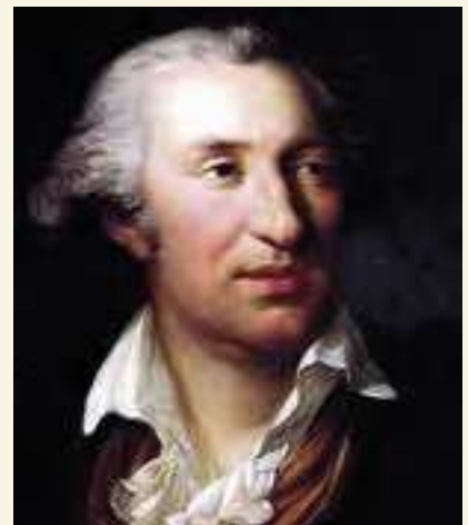
Porträt Johann Gottfried Schadow

Am 3. Januar 1795 wurde der Vertrag unterzeichnet. Eine dazugehörige Zeichnung zeigt recht genau das endgültige Sandsteingrabmal: den einfachen Unterbau mit seitlichen Pilastern, dazwischen mittig die Inschrifttafel – darüber das giebelbekrönte, von Pilastern mit Blattkapitellen gerahmte Flachrelief mit drei mächtigen Frauen, Parzen genannten Schicksalsgöttinnen. Lachesis sitzt links, schaut ins Buch des Schicksals; zu ihr wendet sich die hochgereckte Klotho mit dem vollen Spinnrocken, davon schneidet