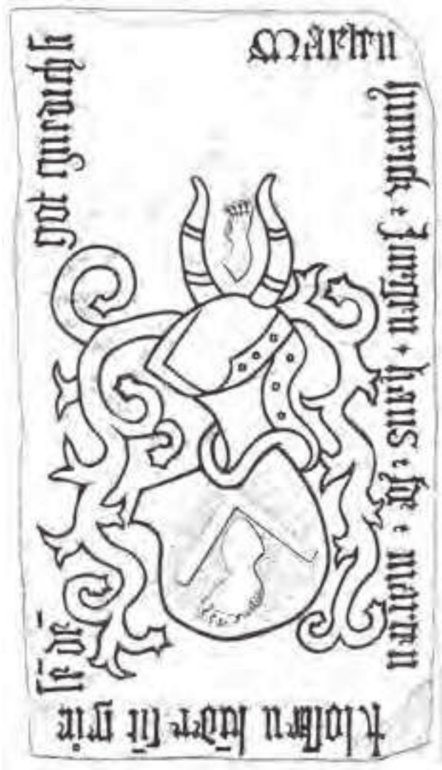
Grabplatte für fünf Kinder des Stendaler Patriziers Marten Klotzen in der Dorfkirche Knoblauch