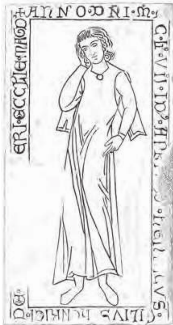
Grabplatte des Pfarrers Lutger in der Dorfkirche Gulow

Burggraf Wilhelm von Cottbus, † 1307, stiftete als Grablege der Familie das Cottbuser Franziskanerkloster. Für ihn und seine Gemahlin, † 1319, ist Mitte des 14. Jahrhunderts eine Tumba geschaffen worden, sicherlich auch hier als Beweis der Legitimität der Stiftung. Erhalten ist die Deckplatte mit den Hochrelieffiguren des Ehepaares auf Löwen stehend. Der Gatte legt seinen Arm um die Schulter der Gemahlin.