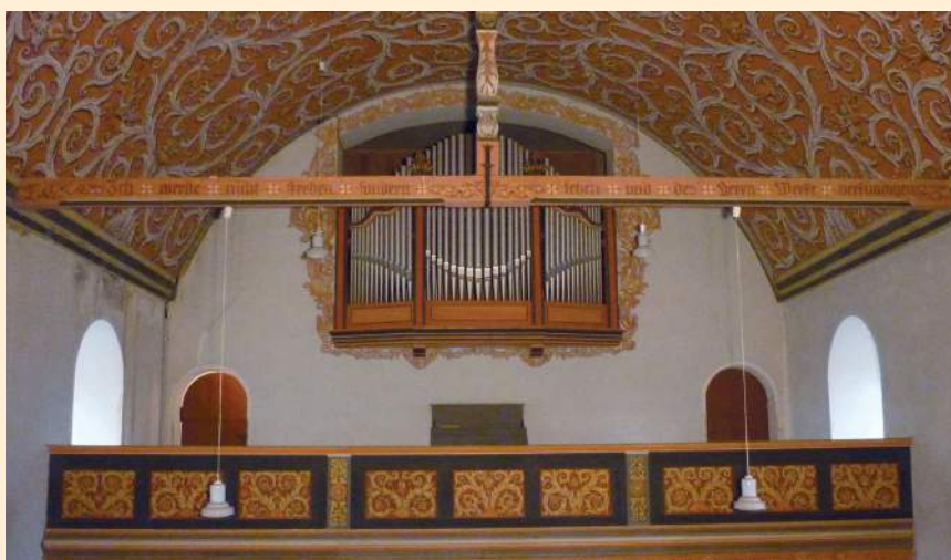
Blick zur Orgelempore

Die vergangenen 90 Jahre haben jedoch deutliche Spuren des Alterns hinterlassen. So ist die einmanualige, mit fünf Registern ausgestattete Orgel, das opus 100 der Firma Schuke / Potsdam, seit mehreren Jahrzehnten nicht mehr bespielbar und bedarf einer kos-