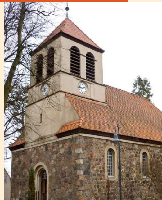
Dorfkirche Steffenshagen von Südwesten, Fotos: Reinhardt Stiller

Durch den Bau des zunächst überdimensioniert erscheinenden, um eine Fensterachsenbreite in das Kirchenschiff versetzten, Turmes waren die Proportionen ins Ungleichgewicht geraten. Steinberg begegnete diesem Problem durch die Konstruktion eines Walmdaches, dessen Flächen so steil nach oben streben, dass sie die Turmmauern großflächig verdecken und in die gesamte Dachkonstruktion einbinden. Im Osten ist der Walm in voller Größe ausgeführt, im Westen hingegen nur im Ansatz erkennbar. Das hochgezogene Walmdach gab Steinberg die Möglichkeit, für den Ausbau des Kirchenschiffs eine neue Raumhöhe zu konzipieren. Als Abschluss nach oben wählte er eine hölzerne Tonnendecke, die den gesamten Kirchenraum überspannt und sich im Chorraum als Konche über den Kanzelaltar wölbt. Zwei Querbalken, die durch geschnitzte Hängesäulen mit der Decke verbunden und am Kämpfergesims verzapft sind, unterbrechen die Raumhöhe und gliedern das Kirchenschiff in drei Abschnitte. Über dem Eingang erhebt sich die von zwei Säulen getragene Orgelempore. Durch jeweils drei große Rundbogenfenster auf den Längsseiten des Raumes fällt Tageslicht in