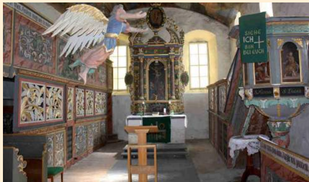
Dorfkirche Waltersdorf, Innenraum nach Osten

biblische Szenen festgehalten, dort tummeln sich unter dem bewölkten Himmelszelt Engel mit Spruchbändern und einer von ihnen schwebt als Taufengel auf die Erde herab. Der Besucher, der durch das Portal mit den original spätmittelalterlichen Beschlägen und den erhaltenen Löchern für den Wehrbalken eintritt, steht im wohl reichsten barocken Kirchenraum des Fläming. Wie lange wird man sich an diesem Anblick noch freuen können? Während sich in Niebendorf seit Jahren eine lebendige Dorfgemeinschaft erfolgreich für die Wiederherstellung und Erhaltung ihrer Kirche einsetzt, scheint es für Waltersdorf keine Hilfe zu geben. Dabei hat man es hier mit einem Gebäude zu tun, das ein touristischer Magnet sein könnte. Stattdessen frisst sich Echter Hausschwamm durch Gesims und Gebälk, ist das Dach nicht mehr wasserdicht, so dass die wertvollen Deckengemälde akut gefährdet und bereits fleckig sind. Nicht mehr nur aufsteigende Feuchtigkeit, sondern starke Nässe bedroht das Mauerwerk, welches im Sockel und um die Fenster bereits Risse zeigt. Der Förderkreis Alte Kirchen