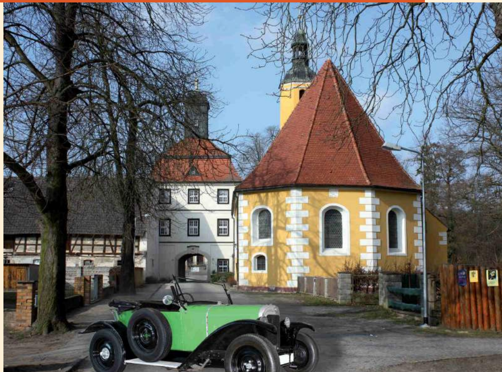
Opel „Laubfrosch“ vor der Schlosskirche Lindenau, Montage: Hascomedia, Berlin

Der Förderkreis Alte Kirchen versucht daher in unregelmäßigen Abständen, jene Bevölkerungsschichten anzusprechen und auf ihre Kirchen hinzuweisen, die auf das Thema Kirche gemeinhin nicht reagieren. Vor ein paar Jahren veranstaltete der