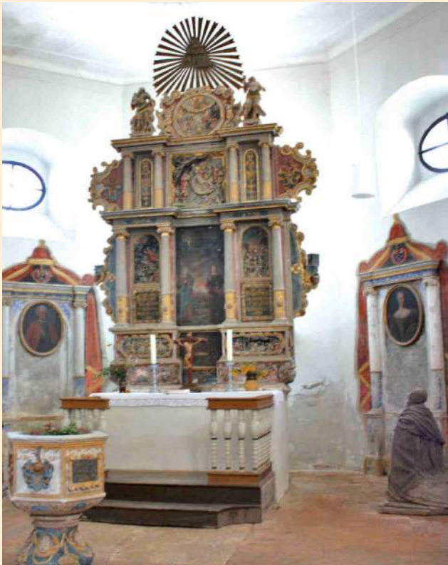
Dorfkirche Bornsdorf, Blick in den Altarraum

Das Kirchlein in Bornsdorf ist ein „Neu“bau des 15. Jahrhunderts, der im 17. Jahrhundert erweitert wurde. Die Ruine eines Vorgängerbaus aus Feldstein kann auf dem alten Friedhof außerhalb des Ortes besichtigt werden. Nach