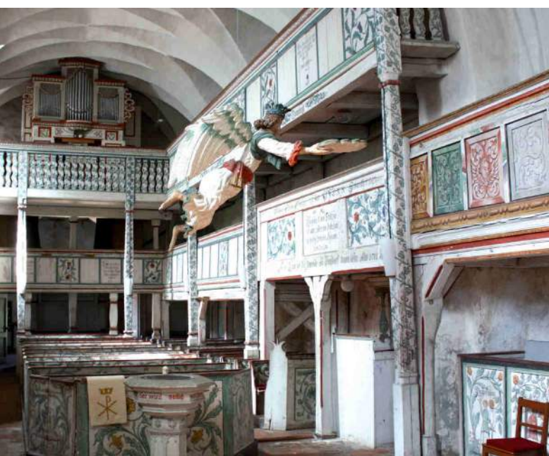
Dorfkirche Massen, Innenraum nach Westen