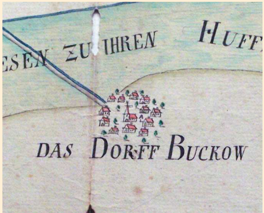
»Plan von der Buckowschen Feld-Marck« von 1722; Domstiftsarchiv Brandenburg (Bu 17/P 754 A 2)

Die Buckower ‚Wallfahrt‘ war bei weitem nicht so bedeutend und einträglich wie die Wilsnacker. Aber auch in Buckow opferten Besucher wert-