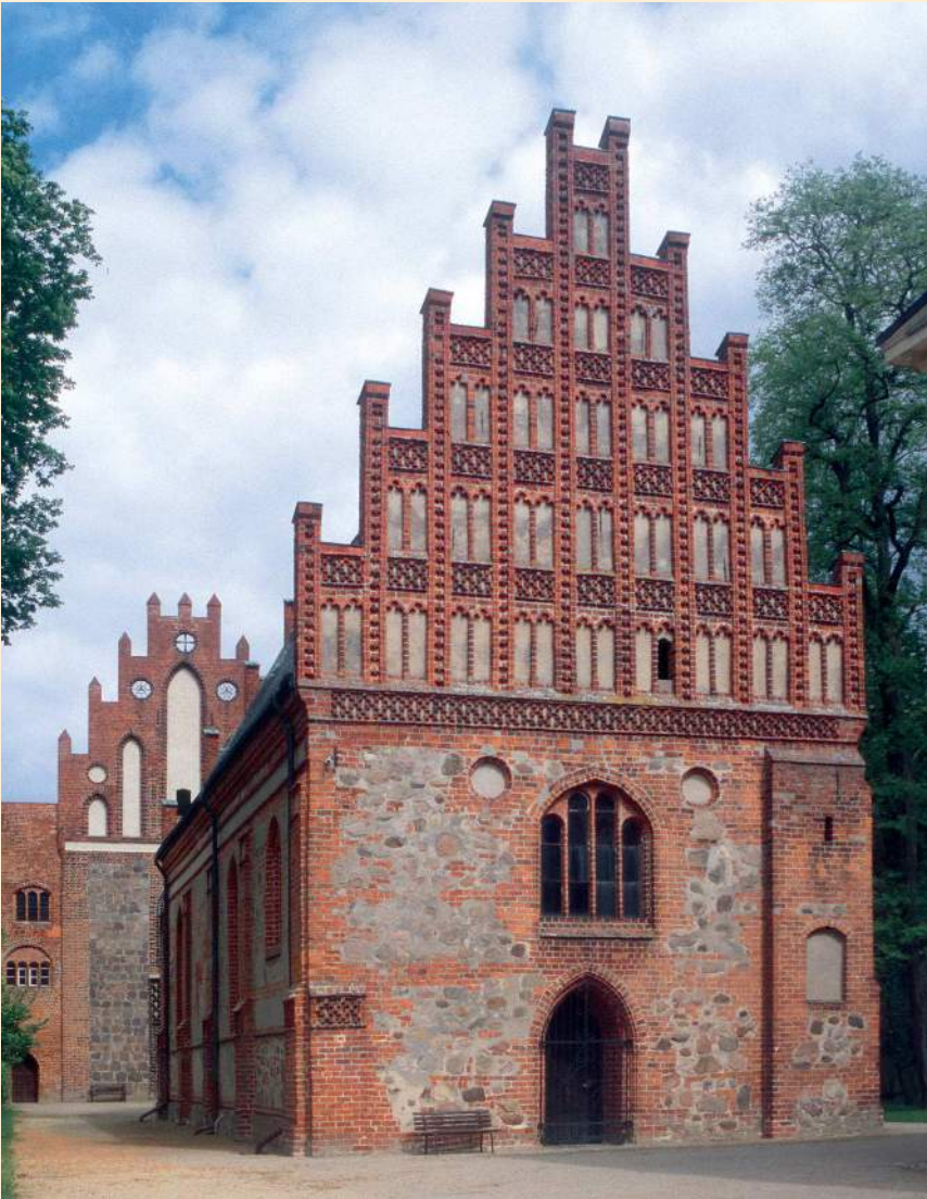
Heiliggrabkapelle, Westgiebel |

bestimmt werden konnten, die sich nicht selten von den aus Quellen bekannten Jahreszahlen unterschieden.