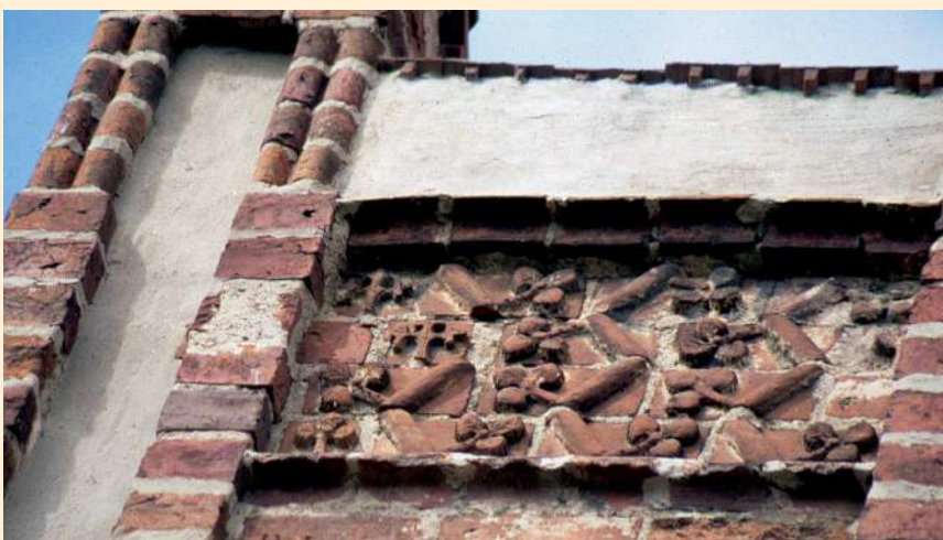
| Wulfersdorf, Formsteine im Giebelfriese

Die Hölzer für das mittelalterliche Dachwerk der Wulfersdorfer Kirche wurden in den Wintern zwischen 1516