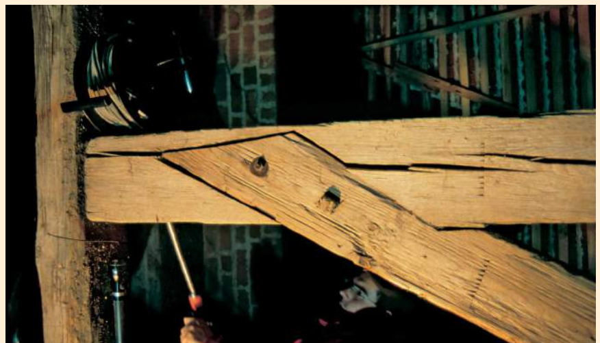
Alt Krüssow, Detail des Dachstuhls mit Abbundzeichen

Diese Tatsache ist natürlich im Falle der beiden sich gleichenden Giebel