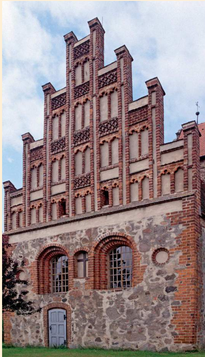
Dorfkirche Wulfersdorf, Westgiebel |

Der Wilsnacker Giebel entstand bald nach der Fertigstellung des dortigen Daches, das schließlich ebenfalls dendrochronologisch datiert werden konnte. Wie die Bauuntersuchungen von Alexander Krauß und Detlev von Olk ergaben, stammen die verwendeten Hölzer entgegen älteren Annahmen erst von 1454.