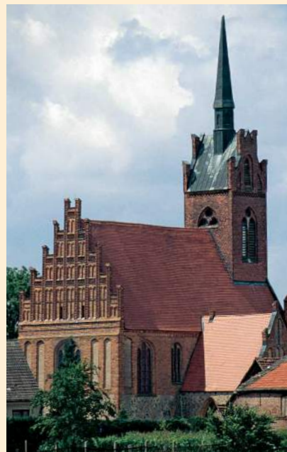
Dorfkirche Alt Krüssow von Nordosten

Wenn auch der Text in der 2000 erschienenen Überarbeitung dieses Handbuches nicht mehr die bemerkenswerte Knappheit von vier Zeilen