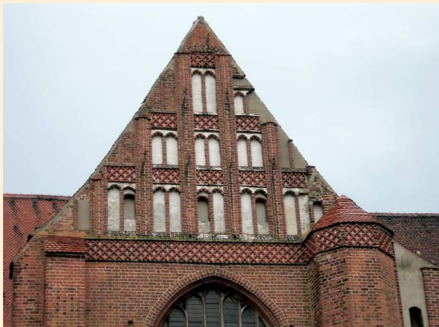
Wallfahrtskirche in Wilsnack, südlicher Querhausgiebel |